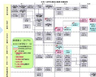
結構技師課程地圖