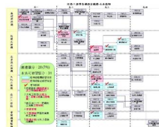
土木技師課程地圖