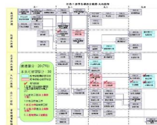
大地技師課程地圖